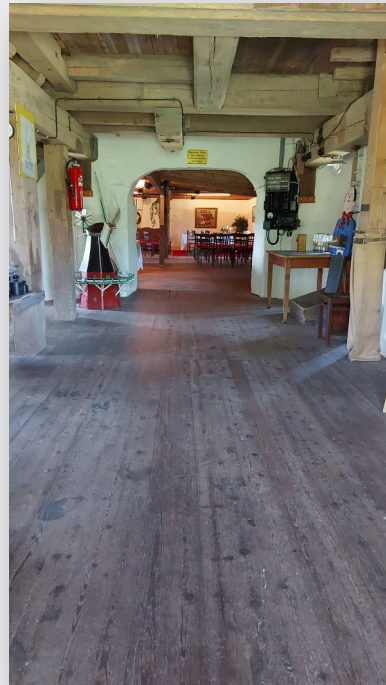
Blick in die Mühle